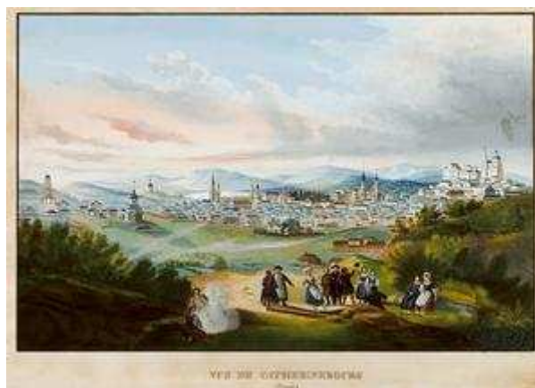
Vue de Catherinebourg (Oural)